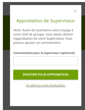
Figure 3: Les participants obtiennent une autre fenêtre dans laquelle ils peuvent joindre le rapport de l'évaluateur de groupe et l'envoyer pour approbation.

Figure 2: Les participants verront apparaître cette fenêtre dont ils pourront cliquer sur "J'ai déjà mon évaluation"