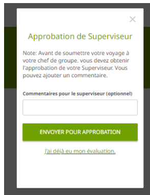
Figure 3: Les participants obtiennent une autre fenêtre dans laquelle ils peuvent joindre le rapport de l'évaluateur de groupe et l'envoyer pour approbation.